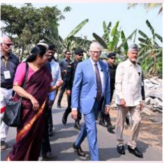
మిగతాది 2 లో

అమరావతి, ఫిబ్రవరి 16 : డేటా లేక్, వాట్సాప్ గవర్నెన్స్ ద్వారా పౌర సేవల్ని సులభతరం చేయడం బాగుందని ఫౌండేషన్ వ్యవస్థాపక చైర్మన్ బిల్ గేట్స్ అభినందించారు. ఆంధ్రప్రదేశ్ అనుసరిస్తున్న విధానాలను పరిశీలించిన గేట్స్ చంద్రబాబును ప్రశంసించారు. రాజధానిలో 30 శాతం గ్రీన్ అండ్ బ్లూ ప్రణాళిక బాగుందంటూ బిల్ గేట్స్ వ్యాఖ్యానించారు. రాజధాని నిర్మాణ తీరును ముఖ్యమంత్రి చంద్రబాబు వివరించగా.. 'గ్రేట్ వర్క్' అంటూ బిల్ గేట్స్ కితాబిచ్చారు. ఆంధ్రప్రదేశ్ పర్యటనలో ఉన్న బిల్ గేట్స్ ముఖ్యమంత్రి చంద్రబాబుతో కలిసి సచివాలయంలోని రియల్ టైమ్ గవర్నెన్స్ కమాండ్ సెంటర్ ను సోమవారం సందర్శించారు. ఆర్టీఐఎస్ కేంద్రం నుంచి పాలనలో టెక్నాలజీ వినియోగాన్ని దగ్గురుండి పరిశీలించారు. రియల్ టైమ్ గవర్నెన్స్ ద్వారా పౌర సేవల్ని వేగంగా అందిస్తున్న తీరు, ఫలితాలను గేట్స్ ఈ సందర్భంగా చంద్రబాబు వివరించారు. డేటా లేక్, అవేర్ 2.0, వాట్సాప్ గవర్నెన్స్, సంజీవని ప్రాజెక్టు, రాజధాని అమరావతి ప్రాజెక్టుల గురించి బిల్ గేట్స్ తెలుసుకున్నారు. ఆర్టీఐఎస్ లోని డిస్ షే వాల్చీపై ప్రజాసేవలను పరిశీలించారు. డేటా లేక్ ద్వారా అన్ని ప్రభుత్వ శాఖలను అనుసంధానించే అమరికను సీఎం వివరించారు. డేటా లేక్, వాట్సాప్ గవర్నెన్స్ ద్వారా పౌర సేవల్ని సులభతరం చేయడం బాగుందని ఈ సందర్భంగా బిల్ గేట్స్ కితాబిచ్చారు.