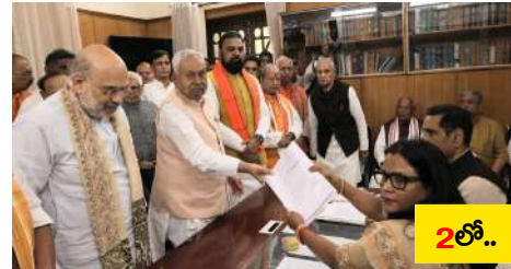
» హాజరైన కేంద్రహోంశాఖ మంత్రి అమిత్ షా పాట్నామార్చి 5 :