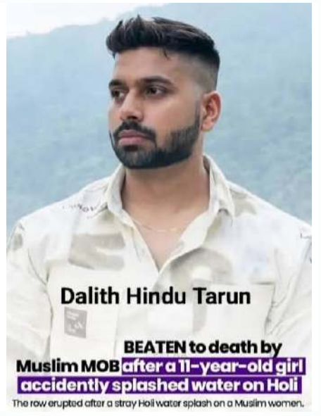
జరిగిన దారుణాన్ని ఖండించడానికి మనసే రానివాళ్ళు,అసలు మనసన్నదే లేనివాళ్ళు... ఇప్పటికీ... మన కళ్ళ ముందే... జంకూ గొంకూ లేకుండా... నిర్భయంగా... ఎలా తిరగ గలుగుతున్నారో?

ఈ సంఘటన, కేవలం ఒక కుటుంబంలో జరిగిన, ఒక కుటుంబానికి మాత్రమే పరిమితమైన విషాదం కాదు. మన సమాజం ముందు నిలచిన నిలవెత్తు ప్రశ్న...మన కళ్ళ ముందే మనలో ఒకడిపై... కసాయి మూకలు దాడి చేసి ..కర్కశంగా .. అమానుషంగా,రాక్షతో... కర్రలతో... ఇసుప