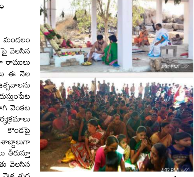
సప్తమి బుధవారం ఉదయం గణపతి పూజ, గోపూజ