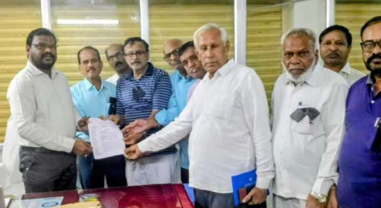
సమర్పించారు. తెలంగాణ రాష్ట్ర ప్రభుత్వం 2024 మార్చి తర్వాత రిటైర్డ్ అయిన ఉద్యోగులకు సంబంధించినటువంటి గ్రాట్యూటీ, కమ్యూటేషన్ మొత్తం విడుదల చేయాలని విసతిపత్రం

మంధని, మార్చి 25 : రిటైర్డ్ ఉద్యోగుల సమస్యలు పరిష్కరించాలని మంధని ఆర్థిక్ సురేష్ ను బుధవారం రిటైర్డ్ ఉద్యోగులు కలిసి విసతిపత్రం సమర్పించారు. ముందస్తుగా తమ సమస్యలు పరిష్కరించాలని నిరసన కార్యక్రమం నిర్వహించారు. తదనంతరం రెవెన్యూ డివిజన్ కార్యాలయంలో ఆర్థివో సురేష్ ని కలిసి విసతి పత్రం