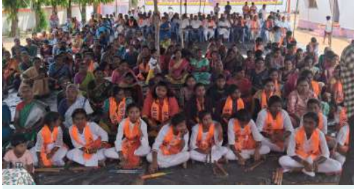
గాజింగి మహేశ్వర్, కరపత్రం మొట్టపల్లి