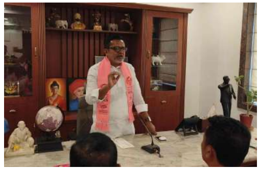
వ్యతిరేక విధానాలను అవలంబిస్తున్న కాంగ్రెస్ పార్టీకి జగిత్యాల నుంచే పతనం మొదలైనట్లనే అన్నారు. మాజీ మంత్రి, కాంగ్రెస్ పార్టీ సీనియర్ నాయకుడు జీవన్ రెడ్డి బీఆర్ఎస్ పార్టీలో చేరుతున్న క్రమంలో జగిత్యాలలో ఈ నెల 20న భారీ బహిరంగ సభ ఏర్పాటు చేసినట్లు, ఈ సభకు తెలంగాణ తొలి ముఖ్యమంత్రి, బీఆర్ఎస్ అధినేత కేసీఆర్ హాజరవుతున్నట్లు చెప్పారు. జీవన్ రెడ్డి రాకతో

కరపత్రం ప్రతినిధి మంధని ఏప్రిల్ 16: సొంత పార్టీలోనే తీవ్ర వ్యతిరేకతను ఎదుర్కొంటున్న కాంగ్రెస్ పార్టీ ప్రభుత్వానికి జగిత్యాల గడ్డ నుంచే పతనం ఆరంభం అవుతుందని మంధని మాజీ ఎమ్మెల్యే పుట్ల మధూకర్ అన్నారు. గురువారం మంధని పట్టణంలోని రాజగృహాలో నియోజకవర్గాన్ని నాయకులతో సమావేశం నిర్వహించారు. ఈ నెల 20న జగిత్యాల జిల్లా కేంద్రంలో కేసీఆర్ బహిరంగ సభ నేపథ్యంలో సభ సక్సెస్ కు నాయకులకు దిశా నిర్దేశం చేశారు. ఈ సందర్భంగా ఆయన మాట్లాడుతూ రెండున్నర ఏండ్ల కాలంలో ఇటు ప్రజల్లో అటు సొంత పార్టీ నేతల్లో కాంగ్రెస్ పార్టీ ప్రభుత్వం, సీఎం రేపంతురెడ్డి విశ్వాసం కోల్పోయారని అన్నారు. ప్రజా