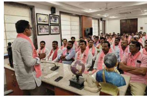
బీఆర్ఎస్ పార్టీకి మరింత బలం చేకూరినట్లు అయిందని, కాంగ్రెస్ పార్టీని జీవన్ రెడ్డి వీడటంలో ఆ పార్టీలో అంతర్గతం మొదలైందన్నారు. మాజీ సీఎం కేసీఆర్ జగిత్యాల కేంద్రంగా నిర్వహించే బహిరంగ సభకు నియోజకవర్గంలోని బీఆర్ఎస్ పార్టీ శ్రేణులు, అభిమానులు, కార్యకర్తలు, ప్రజలు అధిక సంఖ్యలో పాల్గొని విజయవంతం చేయాలని, ఆ దిశగా ప్రతి కార్యకర్త, నాయకుడు కృషి చేయాలని పిలుపునిచ్చారు.