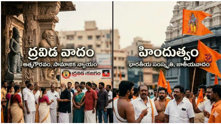
అప్పటి కేంద్ర కాంగ్రెస్ ప్రభుత్వం హిందీని రుద్దడాన్ని వ్యతిరేకించడం ద్వారా ఇది రాజకీయంగా మరింత బలపడింది.

భాషా గుర్తింపు ద్రవిడ భాషలకు ప్రాచీన చరిత్ర ఉందని, ఇవి సంస్కృతం నుండి పుట్టినవి కాదని నిరూపించే ప్రయత్నం జరిగింది. ఆర్య-ద్రవిడ సిద్ధాంతం ద్రవిడులు ఈ దేశపు మూలవాసులని, ఆర్య సంస్కృతి కంటే ద్రవిడ సంస్కృతి భిన్నమైనదని ఈ వాదం బలంగా ప్రచారం చేసింది. సామాజిక సంస్కరణ జ్యోతిరావు పూలే, ఇ.వి. రామస్వామి (పెరియార్) వంటి నాయకులు కుల వివక్షకు వ్యతిరేకంగా, బ్రాహ్మణీకర ఉద్యమంగా దీనిని ప్రారంభించారు. రాజకీయ పరిణామం సాంస్కృతిక ఉద్యమంగా మొదలైన ఇది కాలక్రమేణా శక్తివంతమైన రాజకీయ ఉద్యమంగా మారింది. రాజకీయ అధికారం: తమిళనాడులో 'జస్టిస్ పార్టీ' మరియు ఆ తర్వాత వచ్చిన 'ద్రవిడ కజగం (DK)', 'ద్రవిడ మున్నేట్ర కజగం (DMK)' వంటి పార్టీలు ద్రవిడ అస్తిత్వాన్ని రాజకీయ అక్షరంగా మార్చుకున్నాయి. హిందీ వ్యతిరేక ఉద్యమం