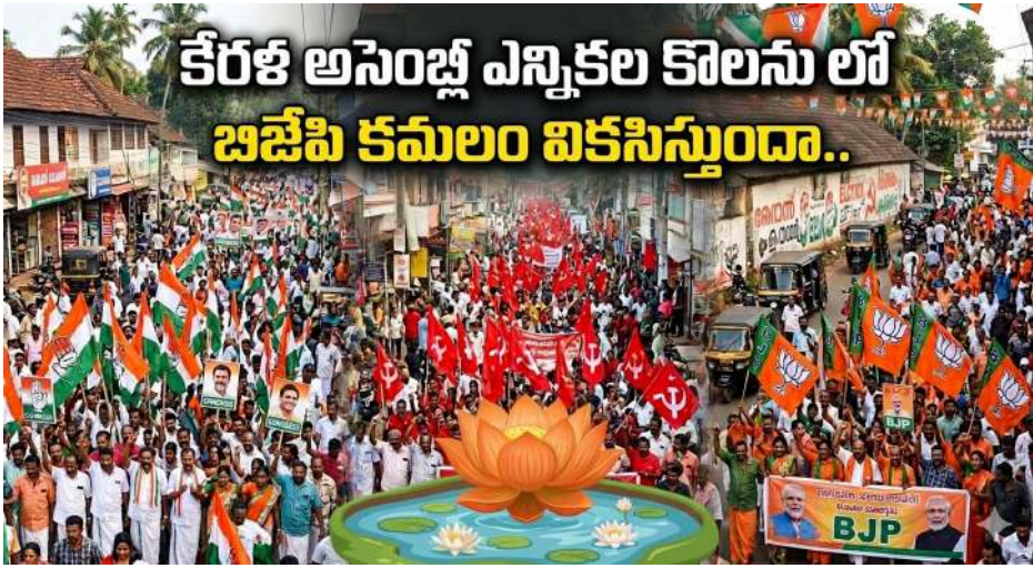
కేరళ అసెంబ్లీ ఎన్నికల కొలను లో బిజెపి కమలం వికసిస్తుందా..

» మాట్రిజ్ మరియు సిఎన్ఎస్-18 బిజెపి 0 నుండి 5 సీట్లు మధ్యన వస్తాయని అంచనా వేశాయి.