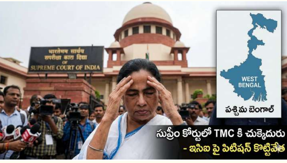
సుప్రీం కోర్టులో TMC కి చుక్కెదురు - ఇనిజి పై పిటిషన్ కొట్టివేత

లెక్కింపు ప్రక్రియలో జోక్యం చేసుకోలేమని, కేంద్ర ఉద్యోగుల నియామకం చట్టవిరుద్ధం కాదని కోర్టు స్పష్టం చేసింది.