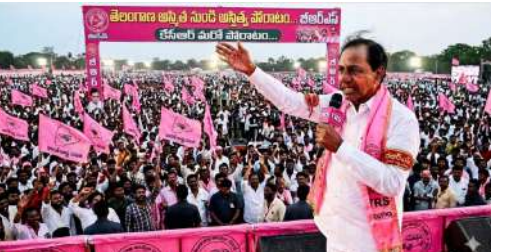
భవిష్యత్తు ఏంటి? అనేదే ఇప్పుడు ప్రధాన ప్రశ్న

ఈ పాతికేళ్లలో రెండు సార్లు అధికారంలోకి కూడా వచ్చిన ఈ పార్టీ.. ప్రస్తుత పరిస్థితి ఏంటి?