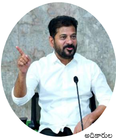
అధికారులు కమిటీని సీఎం రేవంత్ రెడ్డి

హైదరాబాద్, మే 2 : వంద రోజుల్లో ప్రభుత్వ ఉద్యోగుల లటైర్కెంట్ బెనిఫిట్స్ కోసం రూ. 6వేల కోట్లు చెల్లిస్తామని తెలంగాణ ముఖ్యమంత్రి రేవంత్ రెడ్డి తెలిపారు. ఈ నిధుల ఖర్చు ప్రాధాన్యతలు ఉద్యోగుల నిర్ణయస్థానం చేస్తారు. ఉద్యోగుల సంక్షేమానికి కాంగ్రెస్ ప్రభుత్వం కట్టుబడి ఉందని సీఎం మరోసారి భరోసా ఇచ్చారు. ఈ మేరకు సంఘాల నాయకులతో శనివారం సీఎం రేవంత్ రెడ్డి భేటీ అయ్యారు. ఈ సందర్భంగా ఉద్యోగులకు పలు హామీలు ఇచ్చారు. పీఆర్డీపై తక్షణమే రిపోర్టు అందించాలని