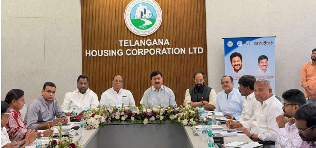
TELANGANA HOUSING CORPORATION LTD