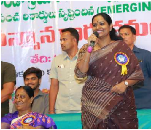
■ మనపై మనకు నమ్మకం ఉంటేనే లక్ష్యాలు సాధ్యం ■ వరంగల్ ఎంపీ డాక్టర్ కడియం కావ్య