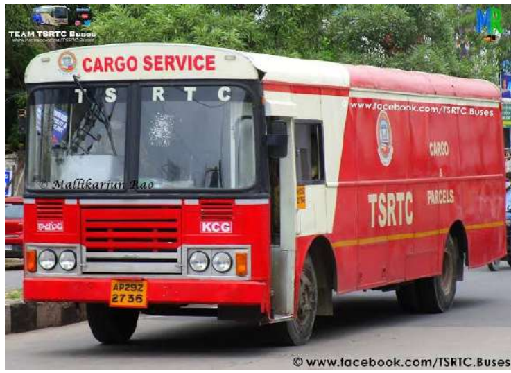
కరపత్రం ప్రతినది గోదావరిఖని మే 12: