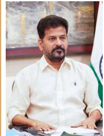
హైదరాబాద్, మే 12 :

ధాన్యం సేకరణ, మొక్కజొన్న కొనుగోళ్ల విషయంలో నిర్లక్ష్యం వహిస్తే సహించేది లేదని ముఖ్యమంత్రి రేవంత్ రెడ్డి స్పష్టం చేశారు. ధాన్యం లోడ్ తరలింపేందుకు ఒప్పందం మేరకు సరిపడా లారీలను అందుబాటులో ఉంచని కాంట్రాక్టర్లకు ఉపేక్షించాడని.. అవసరమైతే అలాంటి