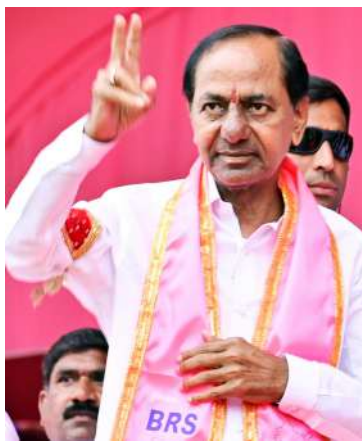
మిగతాద్ది 3 తో

హైదరాబాద్, జూన్ 1 : తెలంగాణ రాష్ట్ర ఆవిర్భావ దినోత్సవాన్ని పురస్కరించుకుని మాజీ ముఖ్యమంత్రి, భారత రాష్ట్ర సమితి అధినేత కల్వకుంట్ల చంద్రశేఖర్ రావు రాష్ట్ర ప్రజలకు, ప్రపంచవ్యాప్తంగా ఉన్న తెలంగాణ బిడ్డలకు హృదయపూర్వక శుభాకాంక్షలు తెలిపారు. ఈ సందర్భంగా రాష్ట్ర సాధన పోరాటంలో అనువులు బాసిన అమరవీరుల త్యాగాలను స్మరించుకున్న కేసీఆర్ వారికి నివాళులు అర్పించారు. తెలంగాణ ప్రజల మీద దశాబ్దాల పాటు సాగిన అణచివేతపై పోరాడి, అనేక అవాంతరాలను అధిగమించి, శాంతియుతమైన పార్లమెంటరీ పంథాలో, ప్రజాస్వామ్య యుతంగా కొట్లాడి స్వరాష్ట్రాన్ని సాధించుకున్నామని కేసీఆర్ తెలిపారు. ఉమ్మడి పాలనలో తీవ్ర వివక్షకు గురై, దిక్కుతోచని స్థితిలో ఉన్న తెలంగాణను స్వయం పాలనలో ఒక దిక్కుచిలా మార్చుకున్నామని, 'పరిపాలన చేతగాదు' అని విమర్శించిన నోళ్ళ మాతపదేలా ప్రగతి పాలనను అందించామని గులాబీ అధినేత గుర్తు చేశారు. నూతన రాష్ట్రంగా ఏర్పాటైన పదేండ్ల కాలంలోనే నకల జనుల సంక్షేమం, సమస్త రంగాల సమగ్ర ప్రగతిని సాధించి, తెలంగాణను దేశంలోనే నంబర్ వన్ రాష్ట్రంగా తీర్చిదిద్దుకున్నామని కేసీఆర్ వివరించారు.