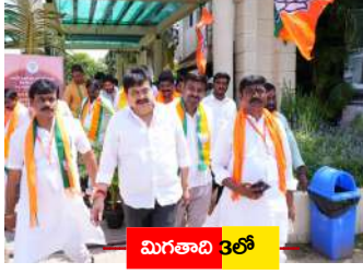
మిగతాద్ది 3 తో

న్యూఢిల్లీ, జూన్ 1 : రేవంత్ రెడ్డి ప్రభుత్వం.. రైస్ మిల్లర్లతో కుమ్మక్కెందని తెలంగాణ బీజేపీ అధ్యక్షుడు రాంచంద్రరావు విమర్శించారు. చివరి గింజ వరకు ధాన్యం కొంటానని సీఎం చెప్పారని.. మరి ఎందుకు నిర్లక్ష్యం చేస్తున్నారని ప్రశ్నించారు.