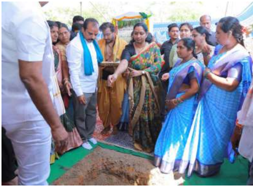
మహిళల ఆర్థిక సాధికారతకు మరో ముందడుగు జిల్లా మహిళా సమాఖ్య 'పెట్రోల్ బంక్' నిర్మాణానికి శంకుస్థాపన